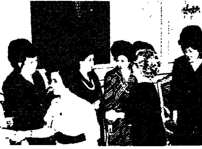
عقبة الرئيس حافظ الأسد اقبلت بابتهاج عشاء تكريما للمشاركات في اجتماع المكتب الدائم للاتحاد النسائي العربي العام